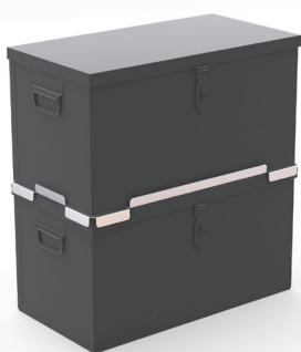
Plateau intermédiaire Réf. PICR670