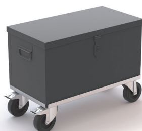
Plateau intermédiaire Réf. PRCR670